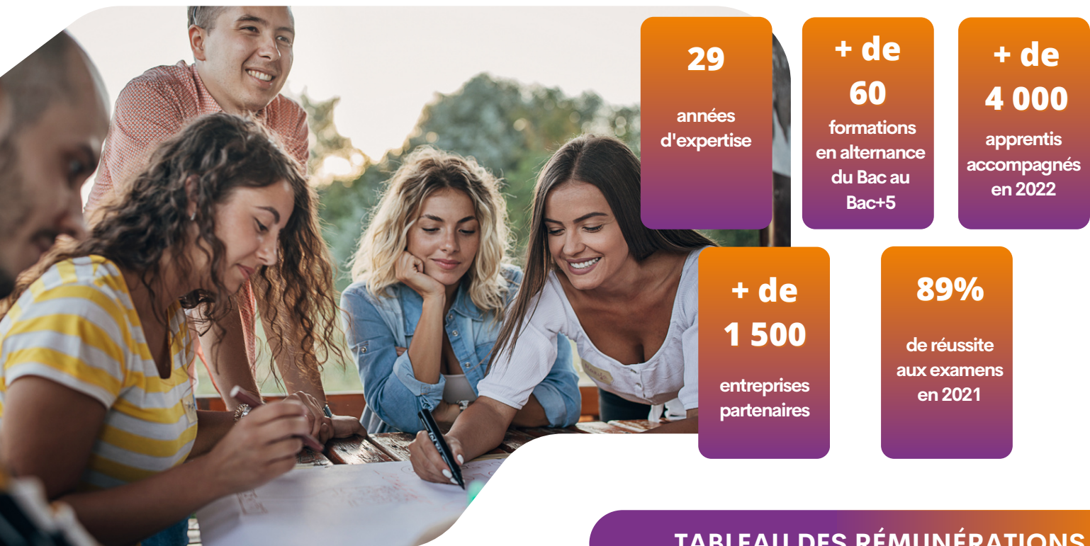
TABLEAU DES RÉMUNÉRATIONS