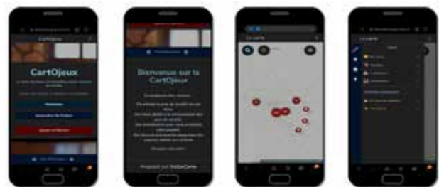
Application CartOjeux réalisée dans le cadre de l'UE d'Innovation pédagogique

Un des principaux atouts du master est la très grande palette de domaines dans lesquels travaillent ses diplômé-e-s. Les compétences du master sont recherchées par les bureaux d'étude, les start-up , les entreprises de réseaux et de services urbains et environnementaux : fibre et télécom, énergies, eau, mobilités... Les diplômé-e-s sont aussi recruté-e-s dans les cabinets de conseil, de géomarketing et les groupes d'assurance. Cette formation prépare également aux métiers de l'information géospatiale au sein des collectivités territoriales, des services de l'État (ministères et préfectures) et des acteurs de la protection civile et militaire (pompiers, gendarmerie ou défense).