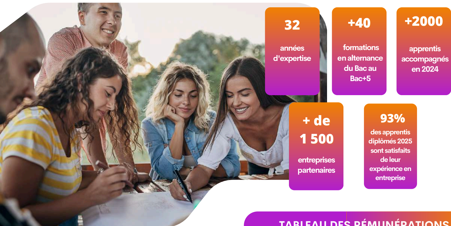
TABLEAU DES RÉMUNÉRATIONS